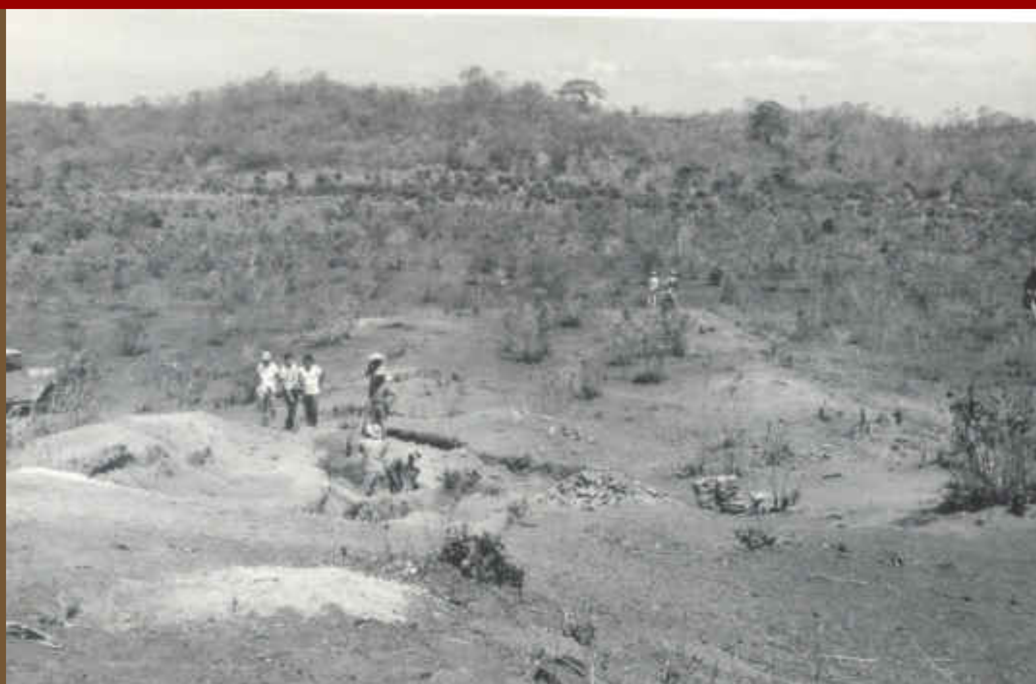
Panorámica de León Viejo. Mayo 1967