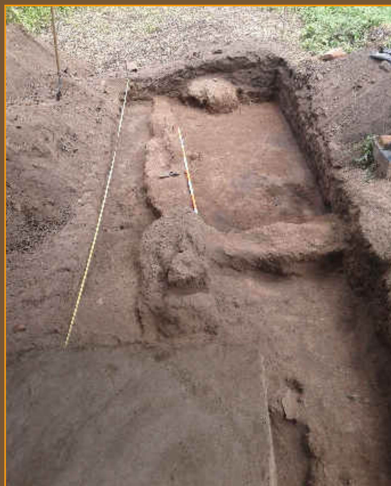
Excavación arqueológica, suroeste". Se identifica prolongación de muro, 2016.