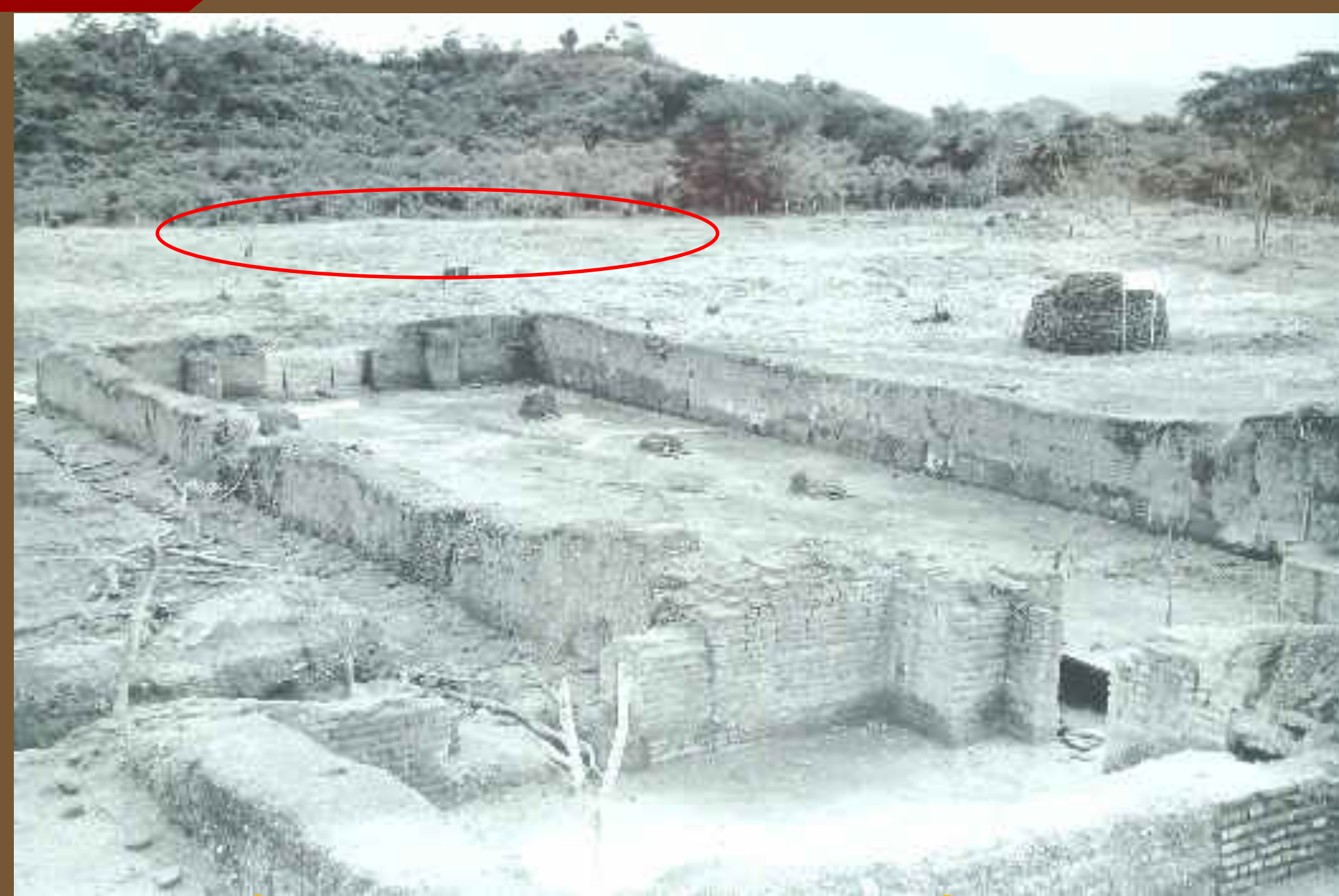
Excavación Iglesia La Merced. Al fondo área de localización de la estructura Casa Gonzalo Cano aún no descubierta, 1967

En 1967 se redescubre León Viejo, con el inicio de las excavaciones arqueológicas coordinadas por Investigadores de UNAN —León. Posterior a este período se realizaron diversas investigaciones en la Casa de Gonzalo Cano, que permitieron obtener mayores datos de esta estructura: