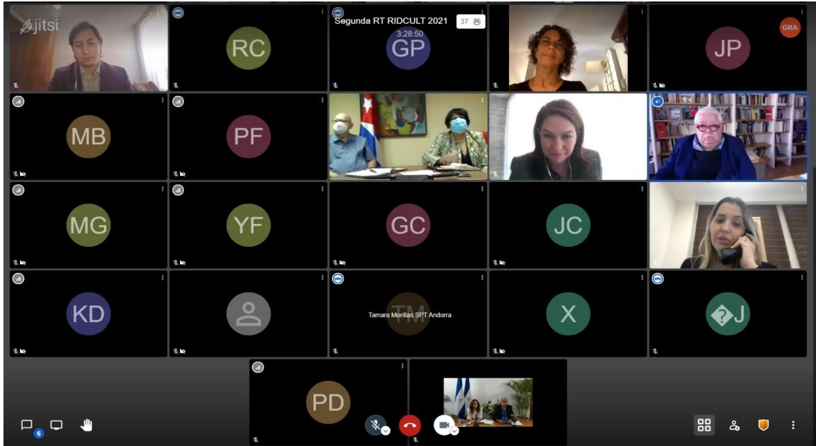
Durante la Segunda reunión de trabajo de la Red Iberoamericana de Diplomacia Cultural, RIDCULT.