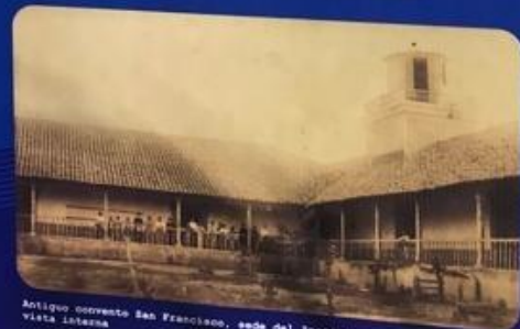
Antiguo convento San Francisco, sede del Instituto Leonés de Occidente, vista interna