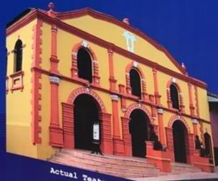
Actual Teatro Municipal de León