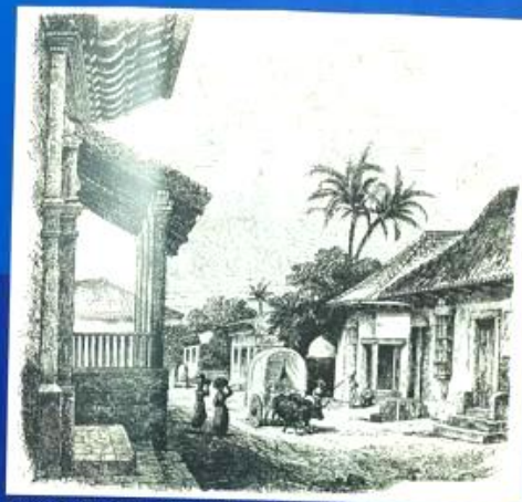
Calle de San Juan, León, 1850, de JAMES M'DONOUGH, dibujante de EPHRAIM GEORGE SQUIER

Seguramente lo irregular del camino, donde las carretas con dificultad avanzan, precipitó los dolores del parto, por lo que hacen un alto en el pequeño poblado de Metapa y buscan una pensión donde albergarse. Pero en aquella aldea no la hay, por lo que aceptan hospedarse en la modesta casa de doña Cornelia Mendoza, donde el 18 de enero de 1867 nace Félix Rubén García Sarmiento