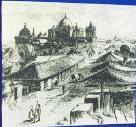
"Catedral de León y Calles" 1850, de JAMES N. DOMOGGI, dibujante de EPHRAIM GEORGE BOQUIER