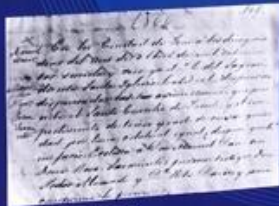
Acta de Matrimonio

ROSA SARMIENTO nacida en Chinandega (1844), huérfana a corta edad, fue adoptada por el hogar del Coronel FÉLIX RAMÍREZ MADREGIL y de BERNARDA SARMIENTO, su tía. Ella con 23 años de edad, se casa con su primo en tercer grado MANUEL GARCÍA, próspero comerciante de 46 años de edad, en matrimonio arreglado por las familias.