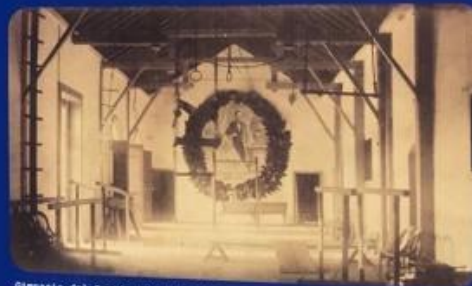
Gimnasio del Instituto Leonés de Occidente, vista interna