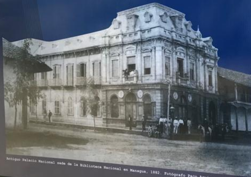
Antiguo Palacio Nacional sede de la Biblioteca Nacional en Managua, 1902.

Del 10 de julio Rubén Darío data la portada manuscrita del tomo I de su primera obra, "Poesías y artículos en prosa", queda sin imprimir.