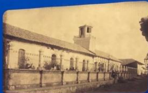
Antiguo convento San Francisco, sede del Instituto Leonés de Occidente

Rubén Darío no finaliza sus estudios, debido a una decisión personal.