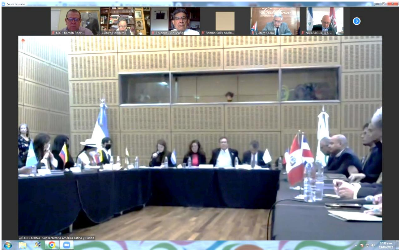
Participantes V Reunión de Ministros y Ministras de Cultura de la CELAC.