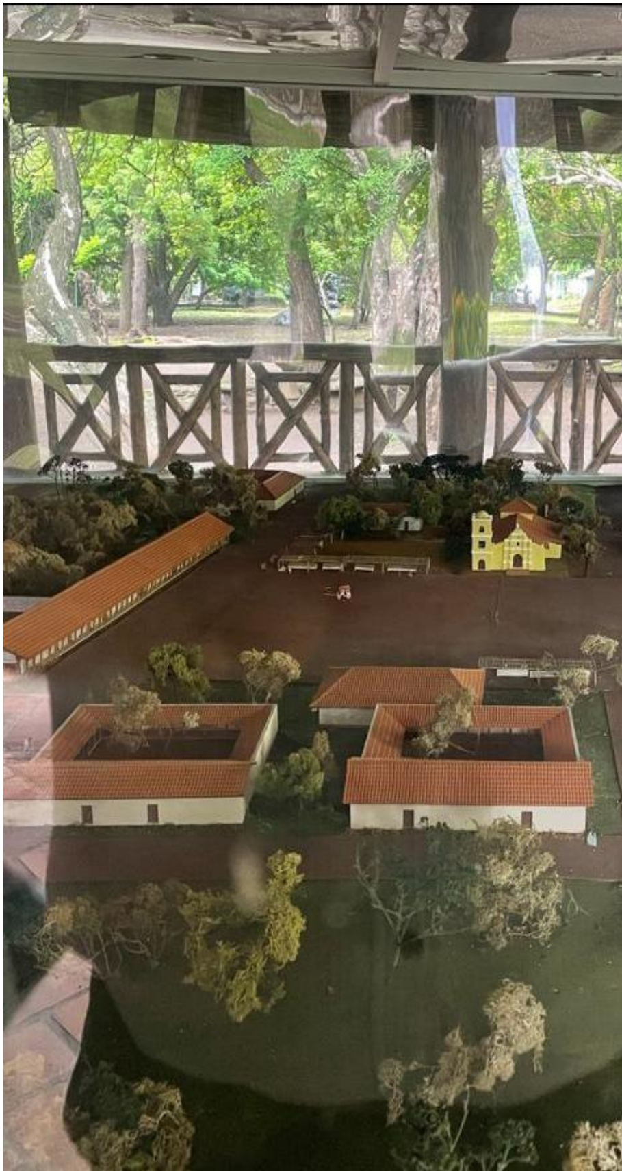
Maqueta hipotética de la antigua ciudad.