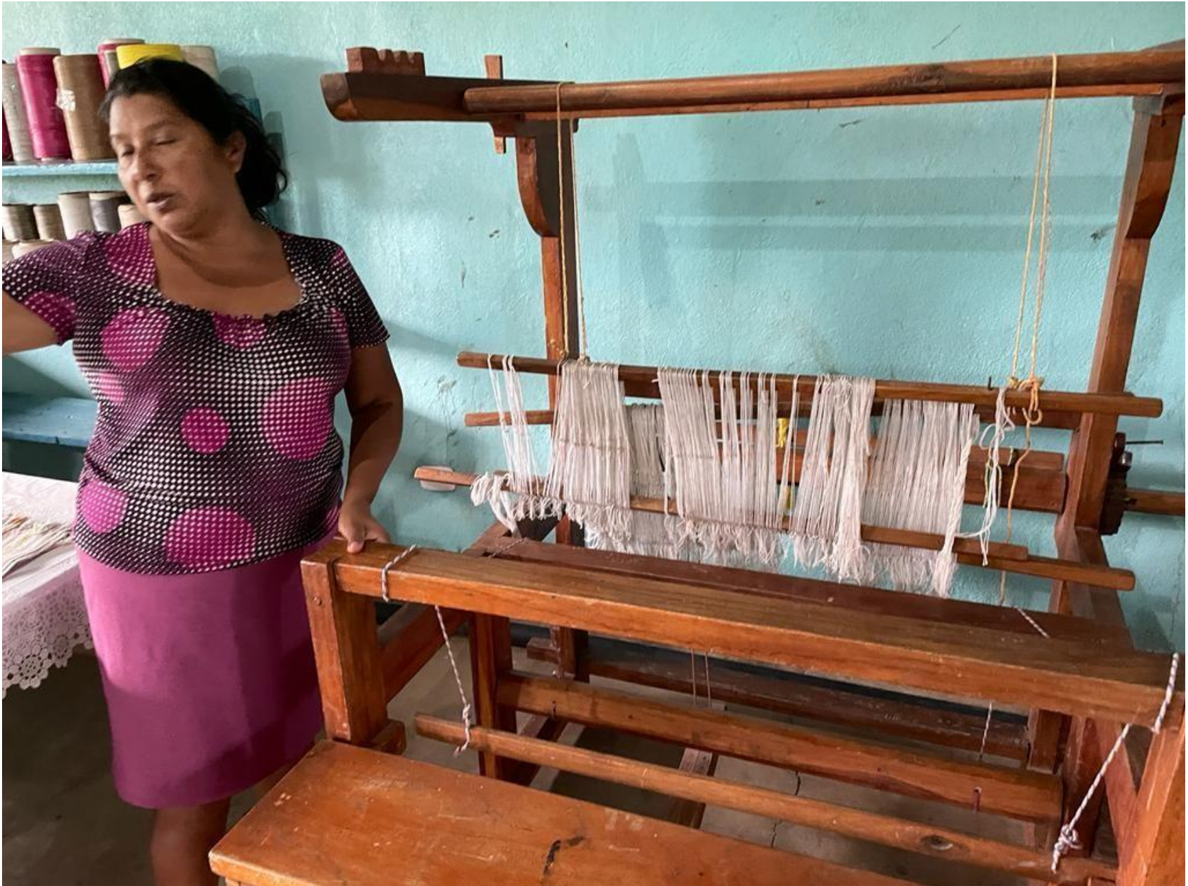
Telar de Mesa o Palanca.