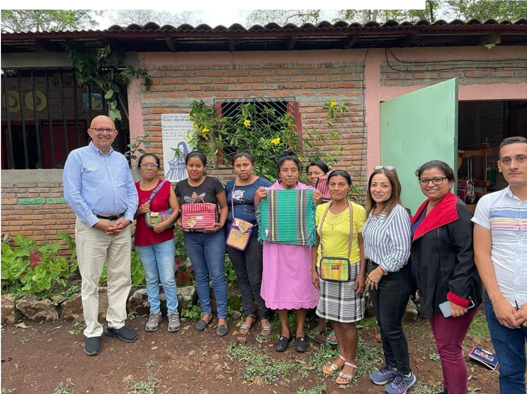
TALLER DE TEJEDORAS TELARES INDÍGENAS NICARAGÜENSES