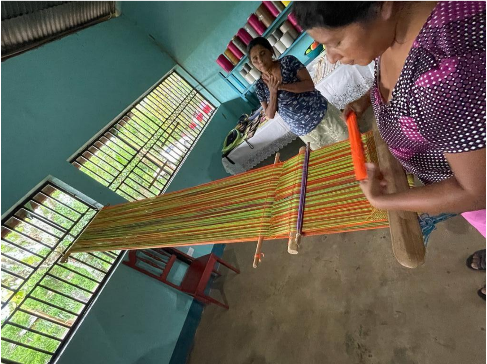
Telar de Cintura.